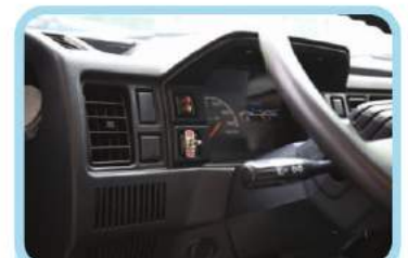
Công tắc nâng hạ thùng ben