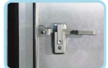
Khóa cửa thùng kiểu thép đúc được nhập khẩu