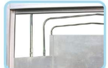
Kèo bạt có thể tháo lắp dễ dàng tùy theo nhu cầu sử dụng