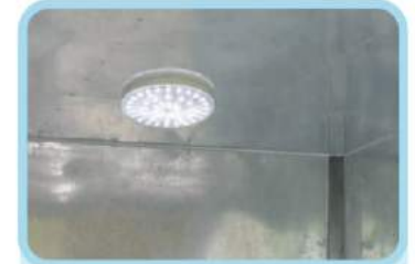
Đèn thùng & công tắc bên trong cabin được thiết kế thuận tiện